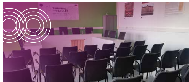
Tribunal de la faculté de Droit financé par la taxe d'apprentissage