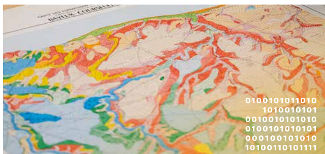
Nouvelle cartothèque de l'UFR SEGGAT : équipements financés par la taxe d'apprentissage